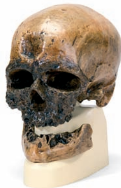
VP751/1 La Chapelle